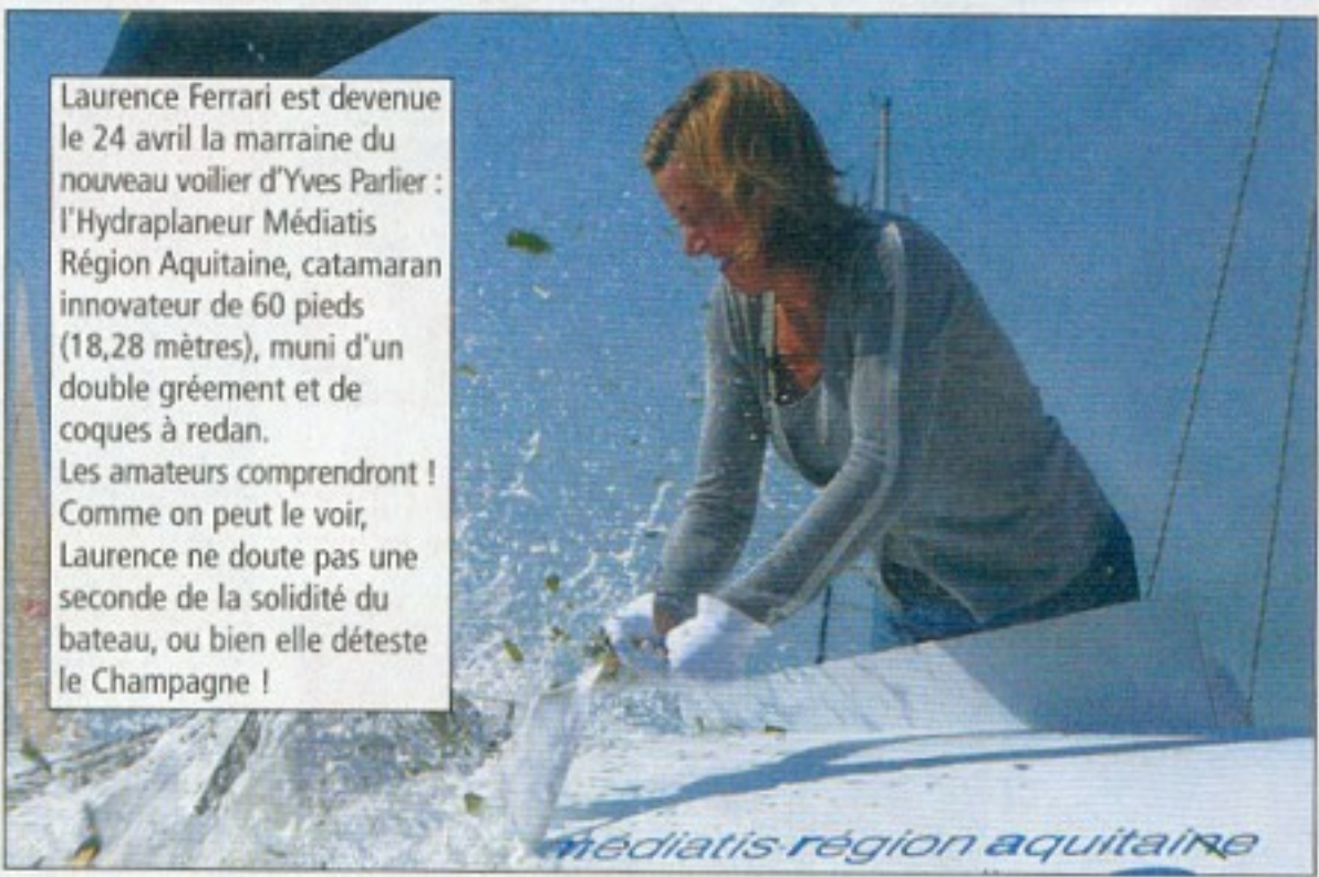
Laurence Ferrari est devenue le 24 avril la marraine du nouveau voilier d'Yves Parlier : l'Hydraplaneur Médiatis Région Aquitaine, catamaran innovateur de 60 pieds (18,28 mètres), muni d'un double gréement et de coques à redan. Les amateurs comprendront ! Comme on peut le voir, Laurence ne doute pas une seconde de la solidité du bateau, ou bien elle déteste le Champagne !