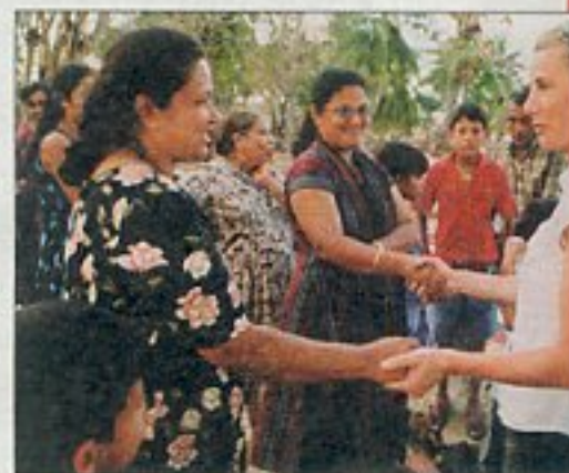
Une présence qui a réconforté ces mères SOS du Sri-Lanka.

Non, car ils ont de quoi manger et boire. Mais j'ai donné des car-